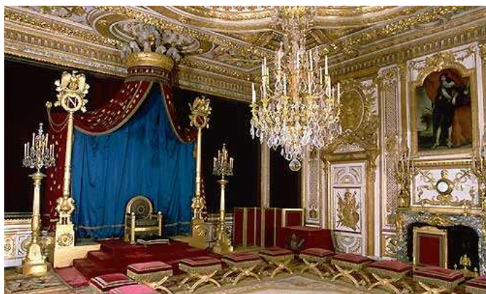
Trono - chambro

Kande rejino Anna de Austria, qua esabis regentino dum la minoreso di lua filiulo Louis XIV mustis cedar a lu la povo, el refujis en la kastelo di Fontainebleau e plubeligis ol. El instalis su en la maxim bela chambro di ca edificio. Inter 1660 e 1665 labori duranta longatempe intersequis en ca loko. Segun Bernard Notari, generala direktero dil aludita kastelo ica chambro : «esas unika en lua baroka beleso, ne existas equivalantajo altraloke en nia