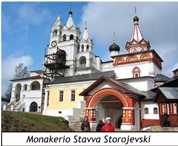
Monakerio Stavva Storozhevskiy

A la pasanta turisti, qui ne havas la fortune havari surloke, Zvenigorod ne klozas tamen la pordi di ta tranquila vivo en la «dacha». Dum ke la Rusa industrio pri turismo orientizas ankore, avan omno, pri la vojaji a Turkia ube luxozaj centri ye kritikebla gusto furnisas flegi por esar en plu bona sanesala stando, audacoza kolokanto esis sate kurajoza por rinovigar Sviazist, anciena sovietala kampejo por vakanco. La portreti di Lenin desaparitis. E la edifici betona remplasesis per domi ligna. Depos tri yari, konstruktita segun diversa arkitekturala programi, la «dacha» tale hike ridivenis ulaspeca rejo. Exterlandani o Rusi, la turisti interrenkontras e sejnornas en ol dum un semano od semano fino. Omna konstruktaji esas ek pinligno, mem la granda «toboggan», ube, dum-vintre la pueri precipitas su sur glitili til la limito dil futbalo-tereno, olqua transformesas a vasta sketeyo.