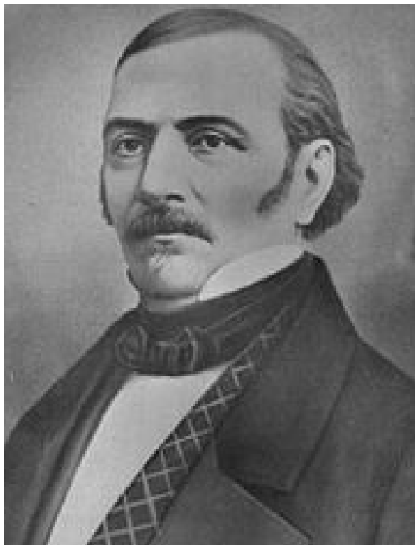
Allan Kardec, patro dil moderna spiritismo