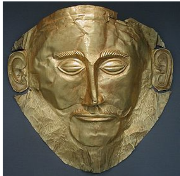
Maskilo ora trovita en Mikenes e surnomizita Agamemnon

La Germano Schliemann deskovris la peizajo di Troia (od Ilion) en 1870 per kritika analizo dil verko da Homeros. Dum longa tempo, la plu multa historiisti kredis ke L'Iliado e L'Odiseo esas nur legendi poeziala. Depos la fino dil XIXma yarcento e la exploradi da Schliemann qui aparigis non civiti konstruktita quik de la