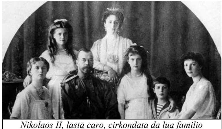
Nikolaos II, lasta caro, cirkondata da lua familio

Pasinta-merkurdie, la statala advokataro di Moskva itere konfirmis, apogante su sur genala expertizi, ke la trovata restaji, un yaro ante nun, en la foresto di Ganina Yama ye l'ekiro dil urbo, esas vere olti di Alexis, la hemofiliika yuna princo mortigita kande il evis 13 yari, e di lua fratino Maria.