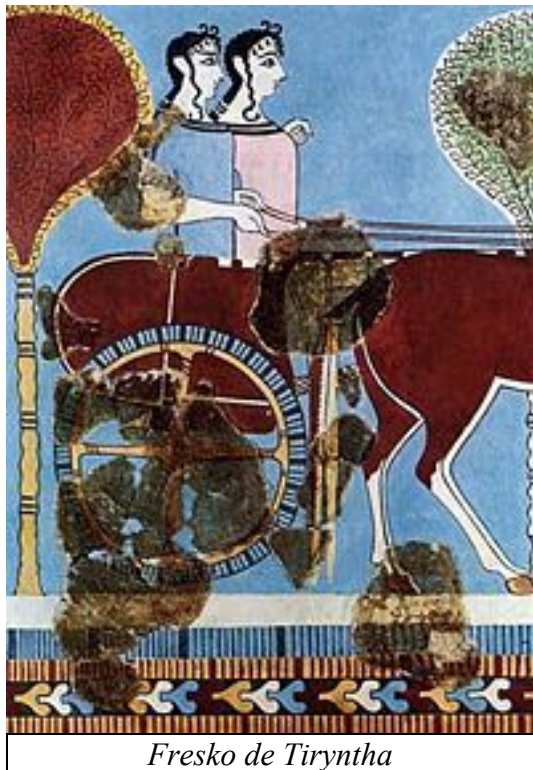
Fresko de Tiryntha

Ilma yarmilo ante nia ero, onu serchis nova indici en la texto da Homeros por trovar sur quala historiala e geografiala elementi la deala vaganta kantisto fundamentizabis lua raporto.