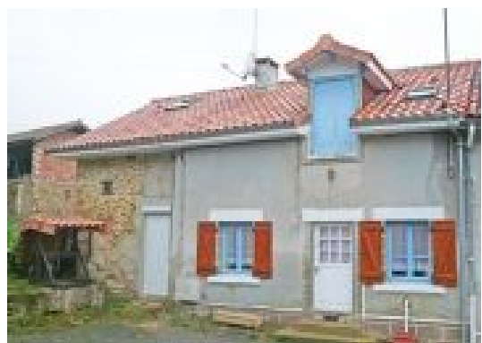
Domo posedata da Angli en la regiono Limousin

La yarala migrado dal Britaniani finas ankorefoye. Parolesas kompreneble pri la retroveno ad Unionita Rejio de granda parto di ca 70.000 proprieteri di domo en Francia, li esas klare plu grandanombra kam la mili de Nederlandani o de Germani. Pro quo ica favorego? Ni ne egardez la avantaji quin prokuras a la Britaniani la tro alte valorigita «pound» (de 12% til 15%, segun expertizisti) ed imoblala merkato acensita til nekredibla alteso, on povas tamen dicernar ulaspeca logikozeso per ica koloko en vicina lando.